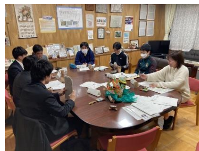
【グループにて熱心に話し合いをしている様子】 (左：小学校グループ) (右：中学校グループ)