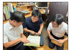
ご自宅では様々な資料を拝見しました。

当時の例会の多くは、北区の黒川にある「名古屋市総合社会福祉会館」で行っており、150人ほど入ることができる大会議室は常に満員の状態でした。当時は午後6時に会が始まりましたが、開始時刻には、ほぼ全ての参加者が集っていました。 例会では教育センターの指導主事や有名な先生が来て講話を行ったり、各学年グループが研究発表を行ったりしていました。特に研究発表では、小学校部会と中学校部会の間で激しく議論を戦わせていましたよ。 ちなみに、当時の全体会では夕食の弁当も出ていました。しかも、食事の際にマイクが順に回ってくるので、校名・氏名を述べるというのが恒例でした。